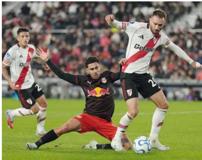
Alternativo. El "Millonario" jugó con un equipo suplente que terminó igualando con el conjunto brasileño.

en la siguiente jugada, pero Maxi Salas envió su cabezazo lejos del palo izquierdo de Cleiton, por lo que se fueron al entretiempo con este resultado.