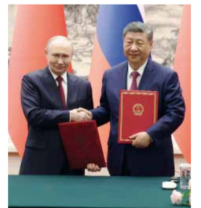
Fuerte lazo. Los dos líderes destacaron la necesidad de impulsar un orden internacional "más justo y multipolar".

El presidente Petro afirmó el domingo que Bolivia vive una "insurrección popular" que, a su juicio, es una "respuesta a la soberbia geopolítica".