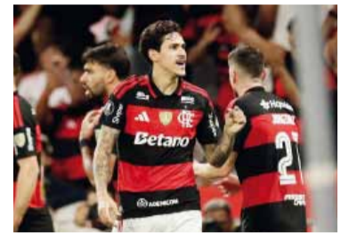
Pedro festeja el gol del triunfo del conjunto carioca.

Estudiantes perdió 1-0 ante Flamengo en el Maracanã por la penúltima fecha de la fase de grupos de la CONMEBOL Libertadores 2025/26 y quedó obligado a jugarse la clasificación en la última jornada frente a Independiente Medellín.