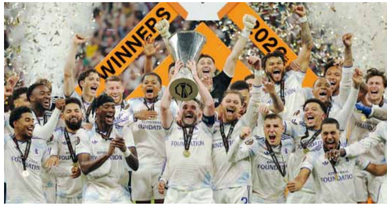
Larga sequía. El equipo de Birmingham no festejaba un título desde la temporada 1995/96 cuando se consagró en la EFL Cup.

Tielemans condujo y habilitó por la derecha a Rogers, quien desbordó y sacó un potente remate