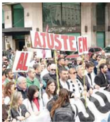
En CABA la movilización fue desde Salud a Plaza de Mayo.

Marcha contra el ajuste: masiva convocatoria en CABA y en todo el país