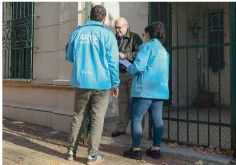
En acción. ARBA puso en marcha un operativo especial para facilitar el acceso a exenciones impositivas.