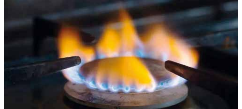
Peligro. Cuidado con el monóxido de carbono.

La Provincia busca descentralizar el sistema y optimizar la atención de emergencias en todo el territorio.