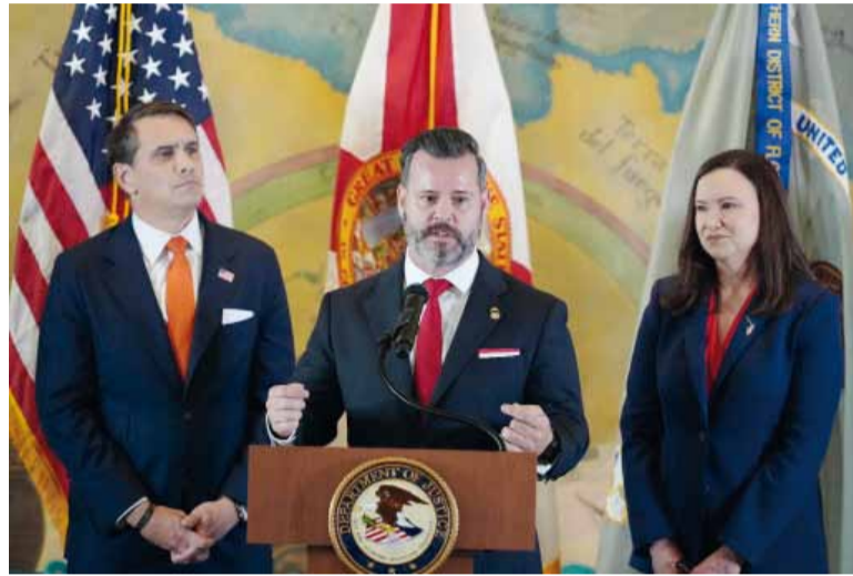
Orden de arresto. Fue emitida por el fiscal, mientras que Cuba denunció una maniobra política y rechazó las acusaciones.