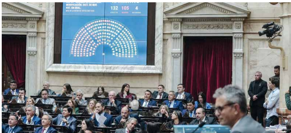
Positivo. El Gobierno se anotó dos triunfos en días de agenda complicada.

El régimen de Zona Fría fue establecido en 2002, básicamente para la Patagonia y un puñado de ciudades bonaerenses. Pero en 2021 fue ampliado por ley, bajo el argumento de que el área en la cual el clima obliga a duplicar consumos es mucho más amplia de la que se había incluido originalmente. Ahora lo que se hace es dar marcha