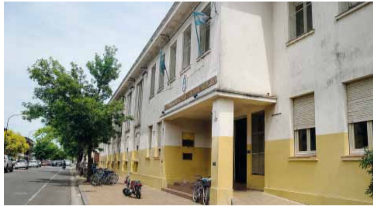
Chivilcoy. la Escuela de Educación Técnica N° 1 "Mariano Moreno".

Durante el proceso judicial, la Provincia negó que hubiera existido un caso de bullying y sostuvo que se trataba de hechos aislados,