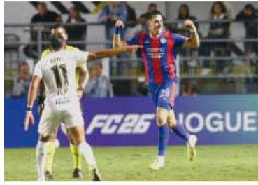
El Ciclón tuvo una gran remontada.

San Lorenzo se repuso ante la adversidad al empatar como visitante 2-2 con Santos de Brasil y consiguió un punto fundamental, que lo acerca a la siguiente instancia y lo hace depender de sí mismo para ser líder del grupo D de la Copa Sudamericana 2026.