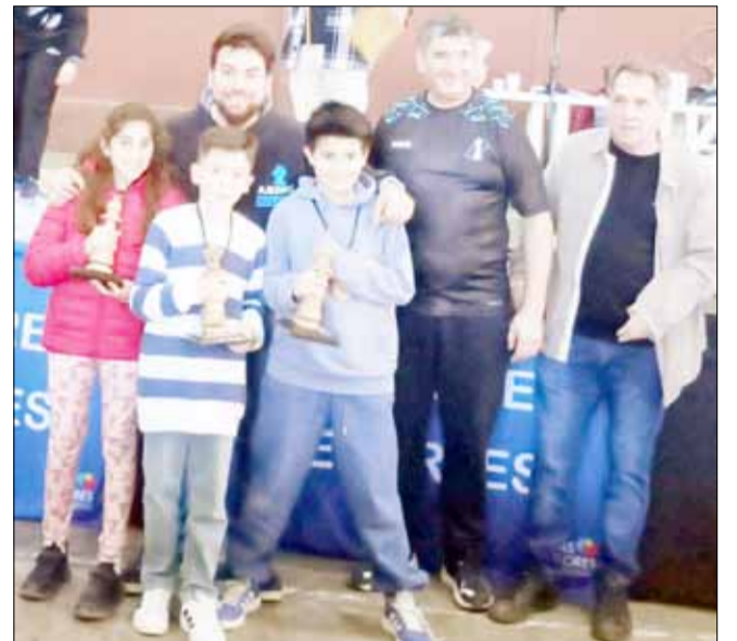
Primer podio netamente bolivarense en un Prix.

Se ofrece señora para cocinera en el campo. Con referencias y currículum. Con años de experiencia. Llamar al cel 15533229.