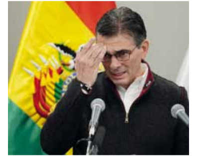
El presidente de Bolivia apuntó contra su par de Colombia.

Bolivia denunció ayer ante el Consejo Permanente de la OEA la existencia de un escenario de "desestabilización" contra el gobierno del presidente Rodrigo Paz, pidió respaldo hemisférico para preservar el orden democrático y solicitó el seguimiento político del organismo regional.